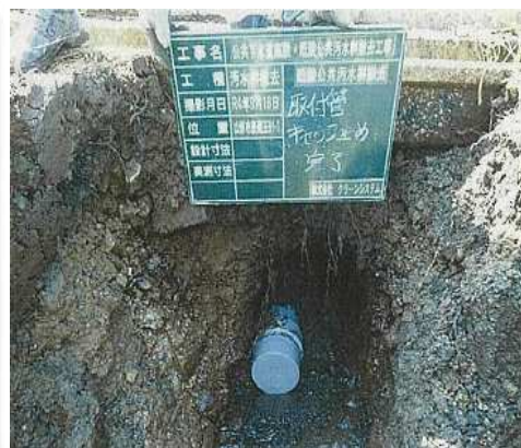
キャップ止め状況