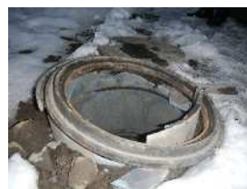
公共ます本体破損状況

また、 誤って公共ますを破損された場合や、破損している公共ますを発見した場合は、下記の間合せ先へご連絡をお願いします。