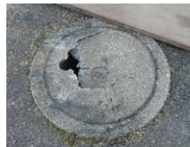
公共ますフタ（市章入り）破損状況

宅内の公共ます（市章入り）は市の所有物です。公共ますは新たに家を新築し、下水を接続するために必要となりますので、建物解体時に撤去しないでください。