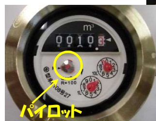
水道メーターボックス