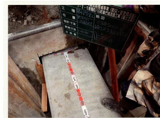
CSB φ 500延長 L=6100