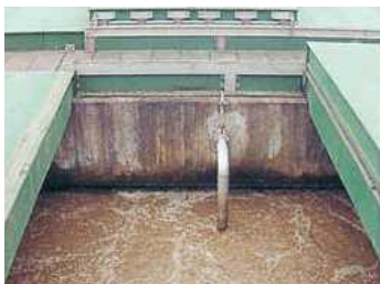
曝気槽(エアレーションタンク)内部