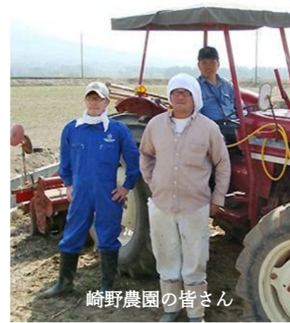
崎野農園の皆さん

茹でたての「嶽きみ」はとってもおいしく、かじると実がプチとはじけて、甘さが口いっぱいに広がりました。その甘さも強いのにしつこくなくて、また食べたくなる味でした♡♡♡