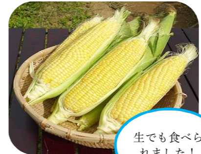
生でも食べられました！